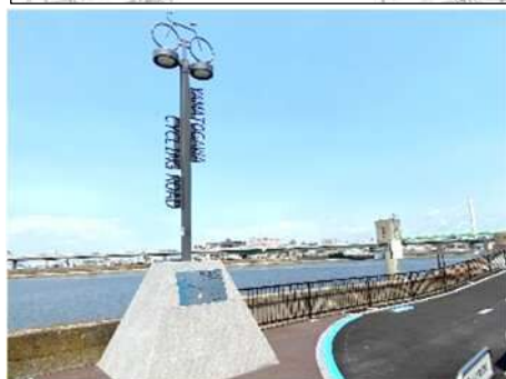
A 大和川サイクル灯