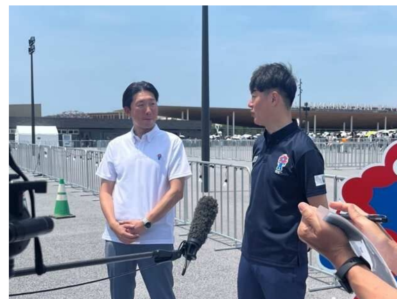
堺市長・大阪市長によるサイクルライン走行会（三宝さくら公園→万博会場）（R7.6.27）