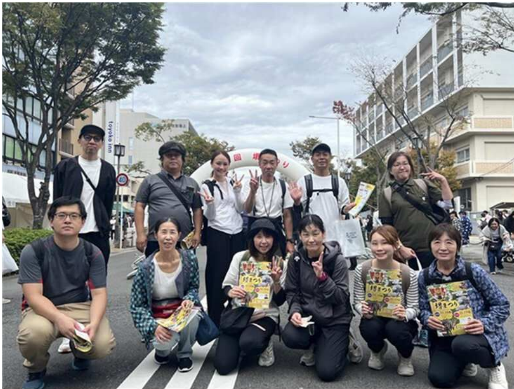
柏原市から「健康」をテーマにしたサイクリングツアー (柏原市役所→堺まつり会場) (R7.10.19)