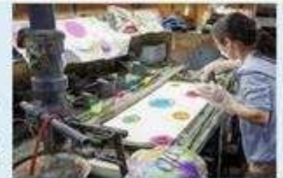
<ファクトリズム散走 染物体験>