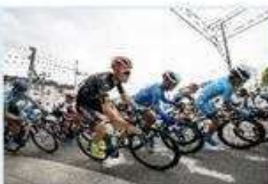
<ツアー・オブ・ジャパン堺ステージ>