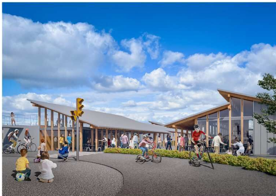
サイクリングエリアから店舗エリアを望む