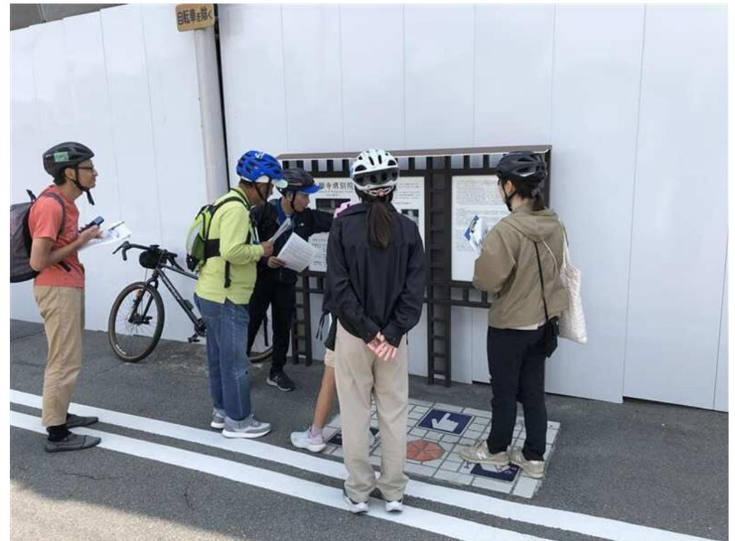
周遊型リアル謎解きゲーム (R7.6.1)