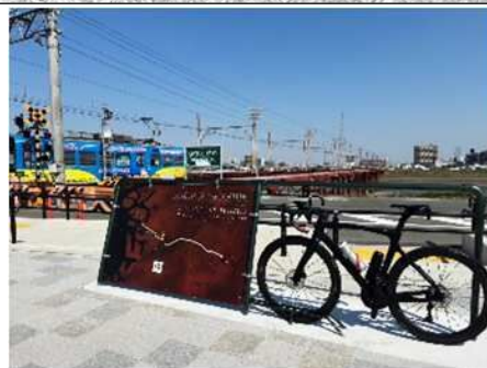
B 大和川サイクルマップ