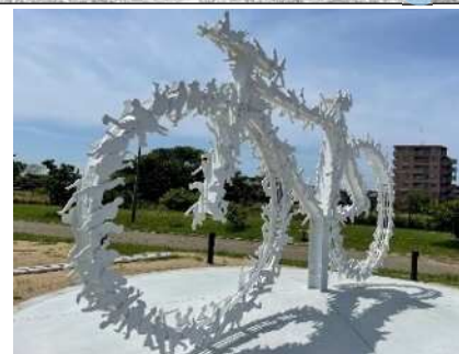
C 大和川サイクルモニュメント