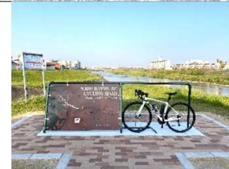
D 大和川サイクルマップ