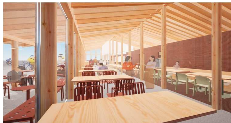
ベーカリーカフェ（テイクアウト、イートインなど）